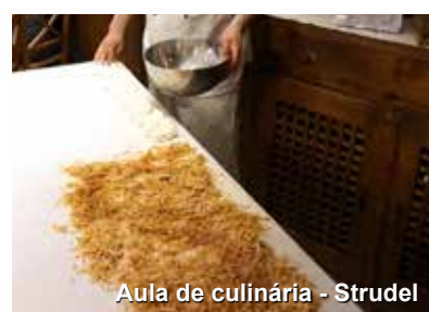
Aula de culinária - Strudel