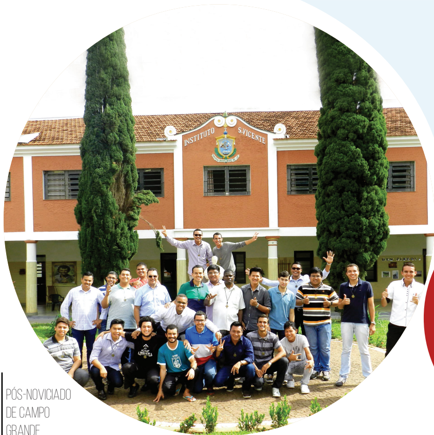
PÓS-NOVICIADO DE CAMPO GRANDE

“A FORMAÇÃO SALESIANA É O CAMINHO PARA TORNAR-SE COMO DOM BOSCO E FORMAR COMUNIDADES QUE TESTEMUNHAM O SEU AMOR DE BOM PASTOR.”