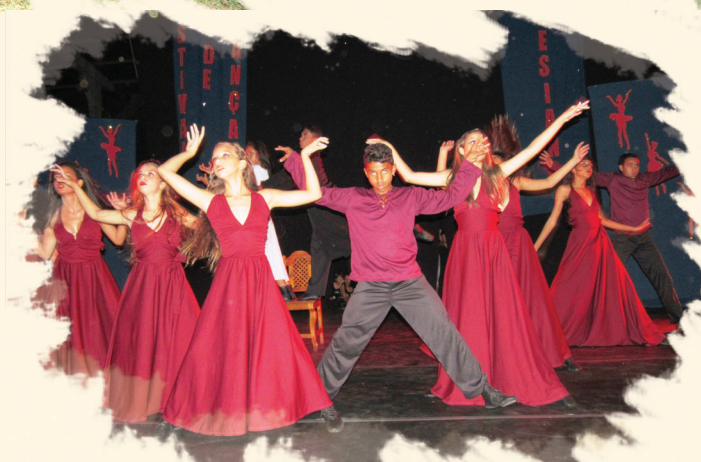
CENTRO JUVENIL SÃO JOÃO BATISTA-POXORÉU