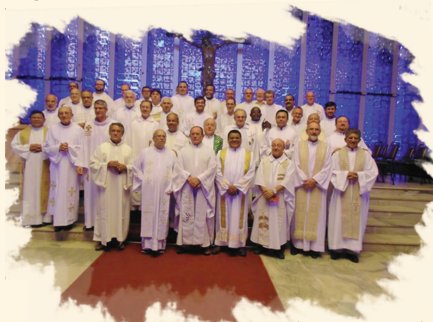
ENCONTRO NACIONAL DE PÁROCOS, REALIZADO EM BRASÍLIA.