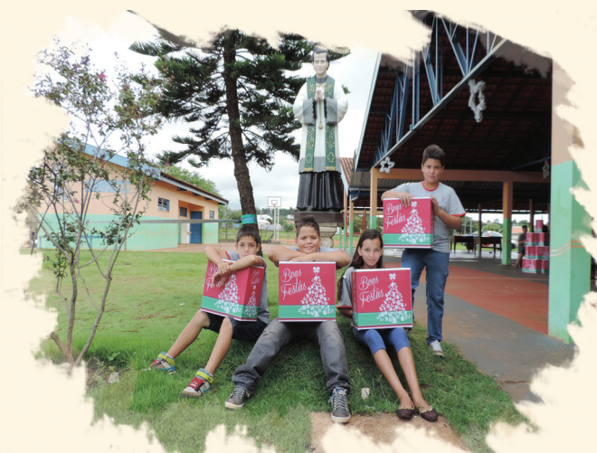
CASA DOM BOSCO - CAMPO GRANDE