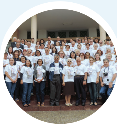
IV CONGRESSO NACIONAL DOS SALESIANOS COOPERADORES, REALIZADO EM CAMPO GRANDE.