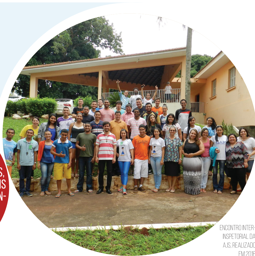
ENCONTRO INTER- INSPETORIAL DA AJS, REALIZADO EM 2016