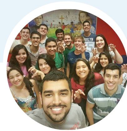
GRUPO EX-ALUNOS DO COLÉGIO DOM BOSCO - CAMPO GRANDE MS