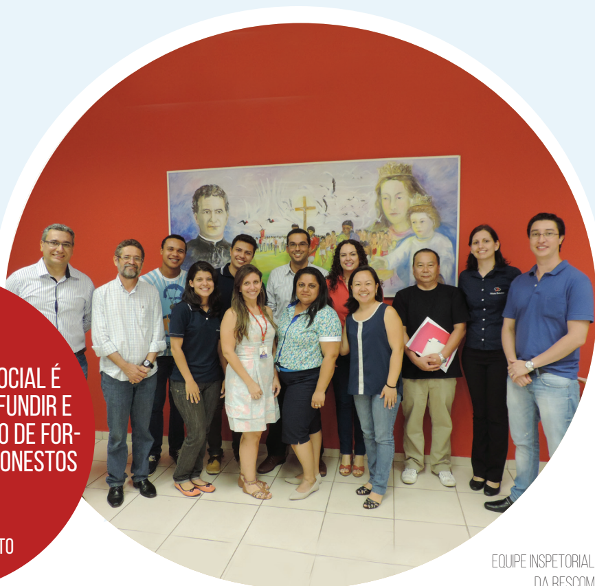
EQUIPE INSPECTORIAL DA RESCOM