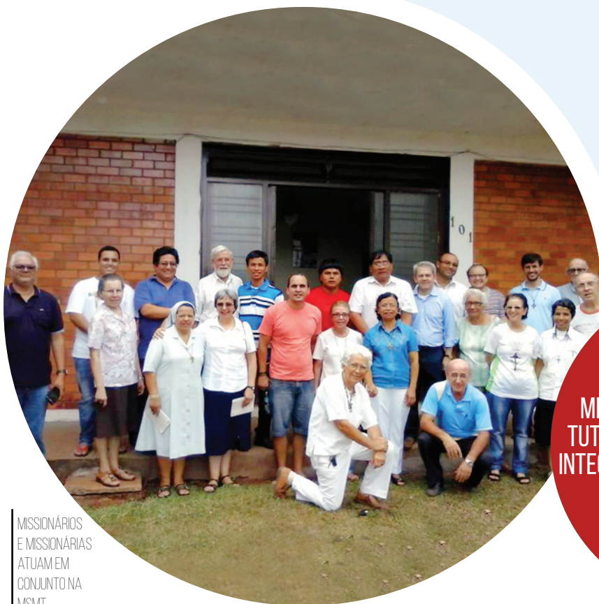
MISSIONÁRIOS E MISSIONÁRIAS ATUAM EM CONJUNTO NA MSMT

“PARA A CONGREGAÇÃO SALESIANA, A DIMENSÃO MISSIONÁRIA É PARTE CONSTITUTIVA DO SEU CARISMA E PARTE INTEGRANTE DA PASTORAL JUVENIL SALESIANA.”