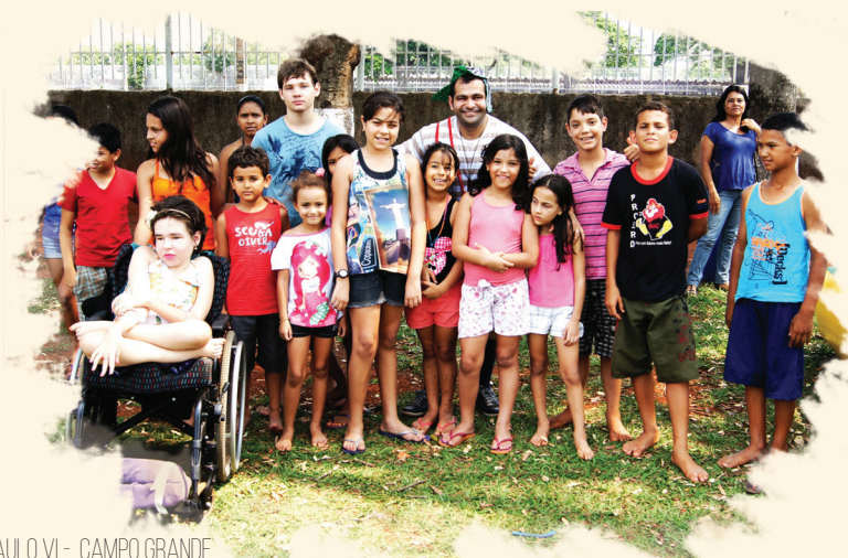
PAULO VI - CAMPO GRANDE