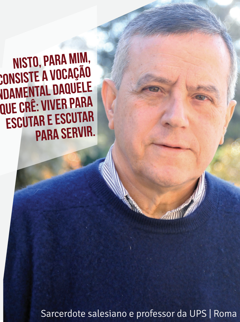
Sacerdote salesiano e professor da UPS | Roma

NISTO, PARA MIM, CONSISTE A VOCAÇÃO FUNDAMENTAL DAQUELE QUE CRÊ: VIVER PARA ESCUTAR E ESCUTAR PARA SERVIR.