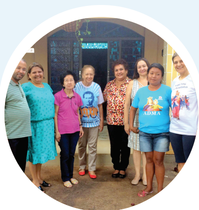
GRUPOS LOCAIS DA ASSOCIAÇÃO DE MARIA AUXILIADORA

no vasto mundo da juventude, dos ambientes populares, dos pobres e das populações ainda não evangelizadas. (Carta da Identidade Carismática da FS, art.º6).