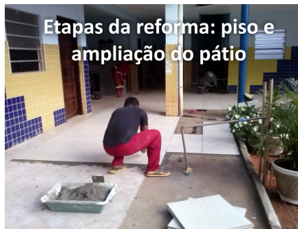
Etapas da reforma: piso e ampliação do pátio