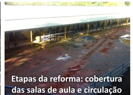
Etapas da reforma: cobertura das salas de aula e circulação

Graças aos recursos dos benfeitores que apóiam os projetos sociais salesianos por meio da União pela Vida, seis salas de aula que estavam com sua estrutura danificada estão sendo reformadas.