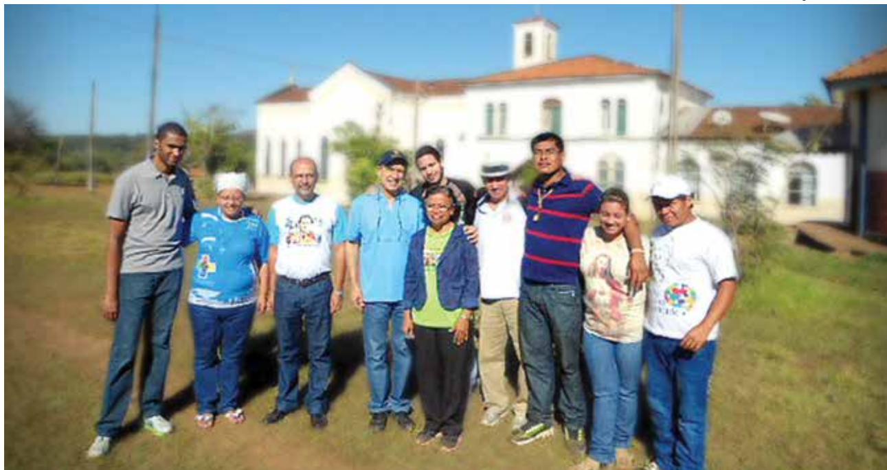
Voluntários visitam a missão salesiana São José de Sangradouro