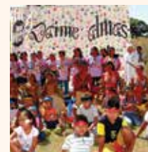
Sagrado Coração de Meruri/MT