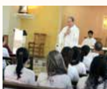
UCDB Campo Grande/MS