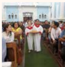
Paróquia São Gonçalo Cuiabá/MT