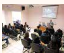
Sede Inspetorial Campo Grande/MS