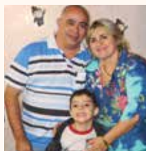
Paróquia Santo Antônio Barra do Garças/MT