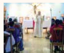
Paróquia Nossa Senhora Auxiliadora Indápolis - Dourados/MS