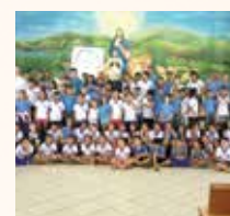
Paróquia NSª Salette e Centro Juvenil Dom Bosco Primavera do Leste/MT