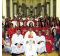
Paróquia São João Bosco Lins/SP