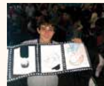
Colégio Salesiano Dom Bosco Três Lagoas/MS