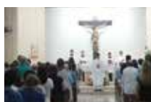
Colégio Salesianos Dom Bosco Campo Grande/MS