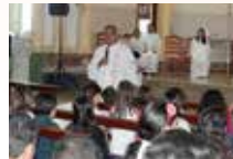
Santuário Nossa Senhora Auxiliadora Corumbá/MS