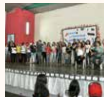
Colégio Salesiano Dom Bosco Três Lagoas/MS