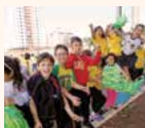
Colegio Salesiano Dom Lasagna Araçatuba/SP