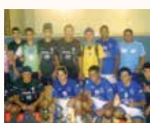
Centro Juvenil São João Batista Poxoréu/MT