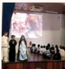
Colégio Salesiano Santo Antônio Cuiabá - Coxipó da Ponte/MT