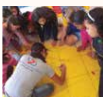
Salesianos Ampare Campo Grande/MS