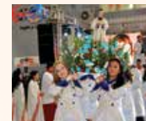
Colégio Salesiano São Gonçalo Cuiabá/MT