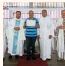
Cidade Dom Bosco Corumbá/MS