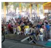
Paróquia S João Batista e Oratório D Bosco Rondonópolis/MT