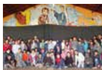
Casa Dom Bosco Campo Grande/MS